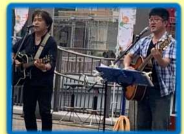
(17:20ごろ～) THE DRUNKERS